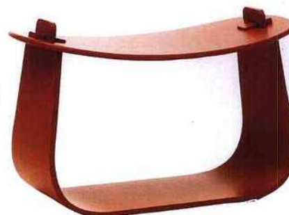
HOMMAGE AU JAPON. Tabouret « Harry High » en bois laqué. Existe en noir, blanc et bois naturel. 32 x 41 x H 47,5cm, 410 €, Massproductions.

Par Sophie-Anne SIEBERT-PEYBERNES - Photos PRESSE