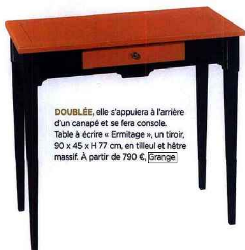
DOUBLÉE , elle s'appuiera à l'arrière d'un canapé et se fera console. Table à écrire « Ermitage », un tiroir, 90 x 45 x H 77 cm, en tilleul et hêtre massif. À partir de 790 €, Grange

Champions des jeux de rôles, chevets, étagères, guéridons, tabourets, consoles... changent de place et de fonction à la moindre de nos envies.