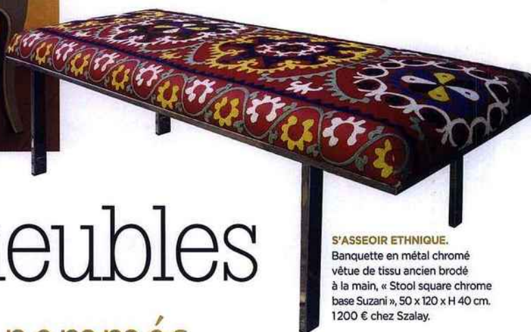
S'ASSEOIR ETHNIQUE. Banquette en métal chromé vêtue de tissu ancien brodé à la main, « Stool square chrome base Suzani », 50 x 120 x H 40 cm. 1200 € chez Szalay.