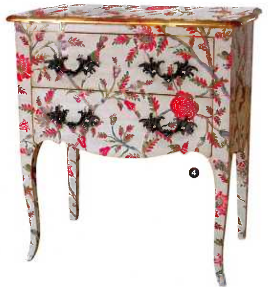
1 Intarsien aus Kamelknochen schmücken die Kommode von HEINE, 108 cm hoch, um 1199 Euro. 2 Die Patchwork-Konsole „Jacob“ aus Lindenholz kombiniert Türen und Schubladen, 142 cm breit, von GRANGE, um 1675 Euro. 3 In die Bücher-Anrichte „San Girolamo“ von POLTRONA FRAU passt auch Geschirr, Preis auf Anfrage. 4 Frühlingsranken sprießen auf der „Poudreuse Louis XV“ von MOISSONNIER, um 4550 Euro. 5 Bauerntruhen wie diese von 1803 bringt das Wiener Dorotheum zur Versteigerung, Schätzpreis: 2000-3000 Euro.