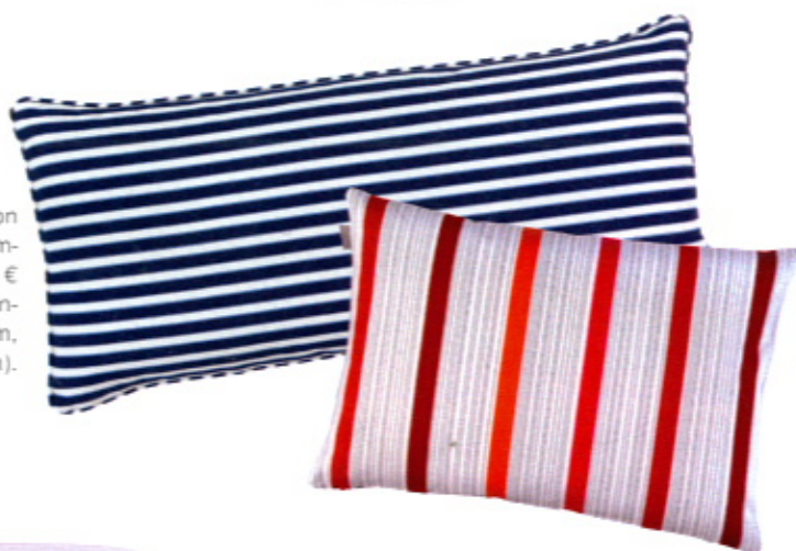
Gestreift: Kissen „Duffy“ von Moltex, 35 x 70 cm, Baum- wolle inklusive Füllung, 48 € (Die Wäscherei); Kissen- hülle „Fia“, 40 x 60 cm, Baumwolle, 13 € (Linum).