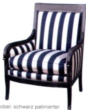
Nobel: schwarz patinierter Biedermeiersessel mit bronzefarbenen Nägeln, 92 x 70 x 73 cm, 1830 € ohne Stoff (Gilles Nouailhac).