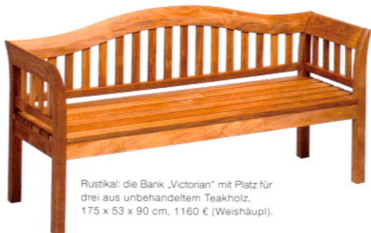
Rustikal: die Bank „Victorian“ mit Platz für drei aus unbehandeltem Teakholz, 175 x 53 x 90 cm, 1160 € (Weishäupl).