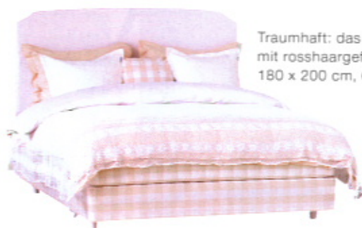
Traumhaft: das Polsterbett „Luxuria“ mit rosshaargefüllter Auflegematratze, 180 x 200 cm, 6950 € (Hästens).