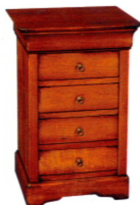
Schlicht königlich: Louis- Philippe-Konsole aus Wildkirsche, 71 x 46 x 39 cm, 1390 € (Grange).

Luxuriöses trifft auf Ländliches, edles Holz auf helle Stoffe und Streifen: So einfach funktioniert der Mix aus Schweden- und Finca-Look.