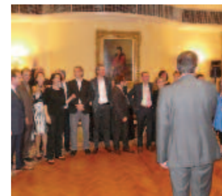
THE GRANGE TEAM