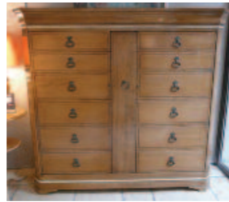
2 visites aux sites de production ont permis à plus de 90 clients de “toucher” le produit. Two tours of the factory enabled more than 90 participants to really touch the products.