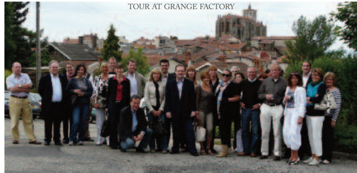
Les équipes de production GRANGE ont été ravis des échanges fructueux et de l’intérêt des visiteurs. Grange’s production workers were extremely happy that these visits took place and that they were able to discuss a little of their work with real customers.