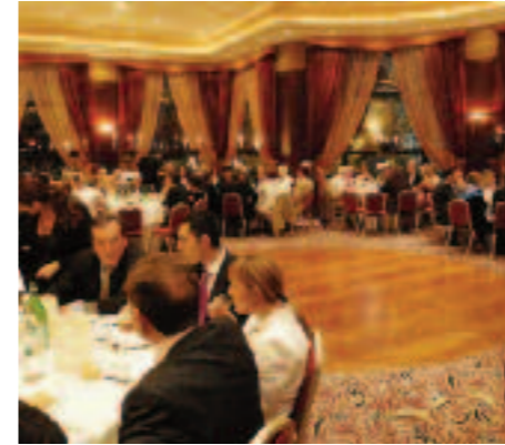
GALA EVENING AT CASINO LE LYON VERT